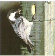
Furnus alpestris , la Mallorera petita (ORCIBER CLUCKE)

Opportunitat de treballar amb el món de la cultura i de la comunicació. El món de la cultura i de la comunicació és un món que està canviant i que necessita persones que s'adaptin a aquest canvi.