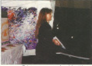
Informació reportat del 1996